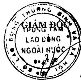
Hà Xuân Tùng