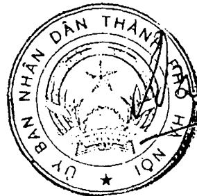
Chu Ngọc Anh