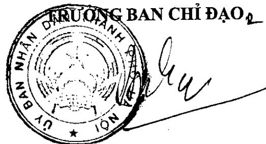
CHỦ TỊCH UBND THÀNH PHỐ Chu Ngọc Anh